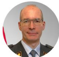
Oberst i Gst Ludovic Monnerat Commandant du centre de compétences spatial de l'armée suisse