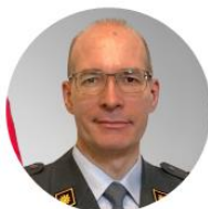
Oberst i Gst Ludovic Monnerat Commandant du centre de compétences spatial de l'armée suisse