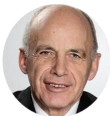
Ueli Maurer Conseiller fédéral Chef du DFF