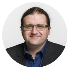
Dr. Jörg Mäder Conseiller national PVL/ZH Programmeur indépendant