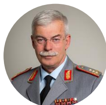
Jörg Vollmer Général lib, Bundeswehr